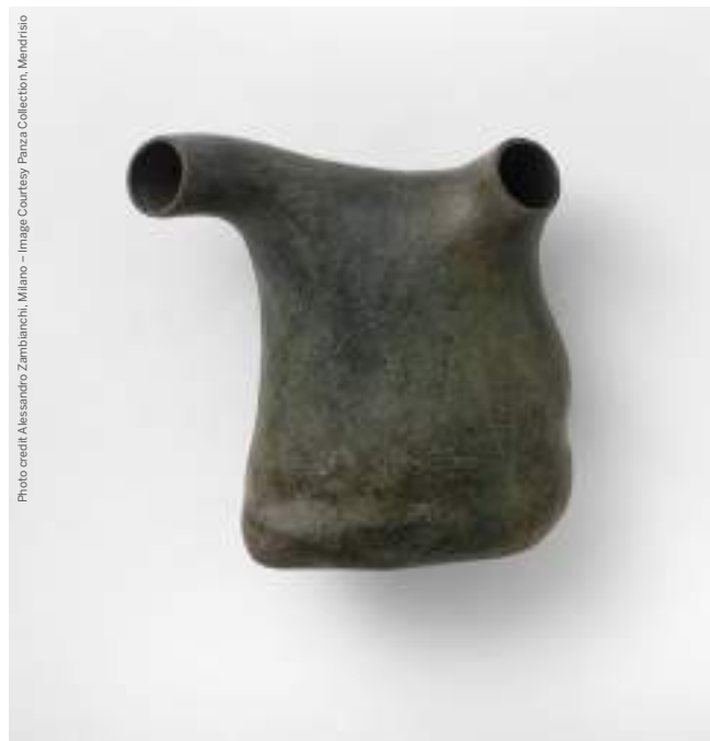
Peter Shelton, whitebody , 1990

Da novembre 2022 vieni con la tua classe per scoprire alcune delle opere e nuovi percorsi presentati per la prima volta a Villa Panza, in occasione della donazione di oltre 100 opere di arte contemporanea dalla Panza Collection , Medrisio.