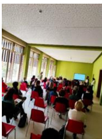
L'assemblea generale svoltasi il 24 ottobre 2022