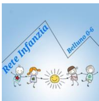
Il logo della Rete Infanzia Belluno 0-6