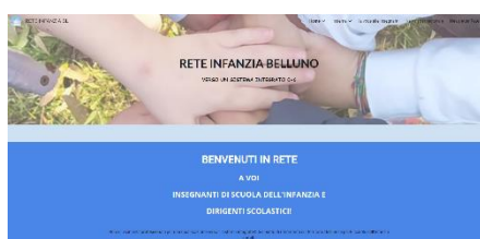
Sito Rete Infanzia Belluno https://sites.google.com/comprensivofeltre.edu.it/rib-belluno